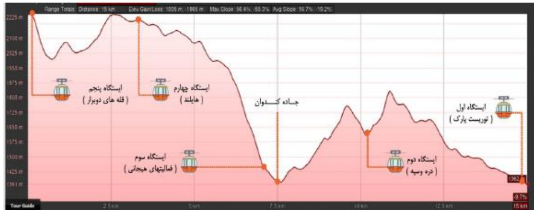
شکل: موقعیت محور تله کابین در حریم شمالی