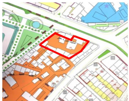
میدان شاه عباسی(قدس)/ روبروی کاروانسرای شاه عباسی